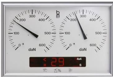
Afmetingen: 735x400x140 mm (bxhxd)