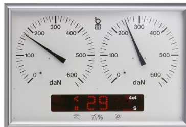
Afmetingen: 735x400x140 mm (bxhxd)